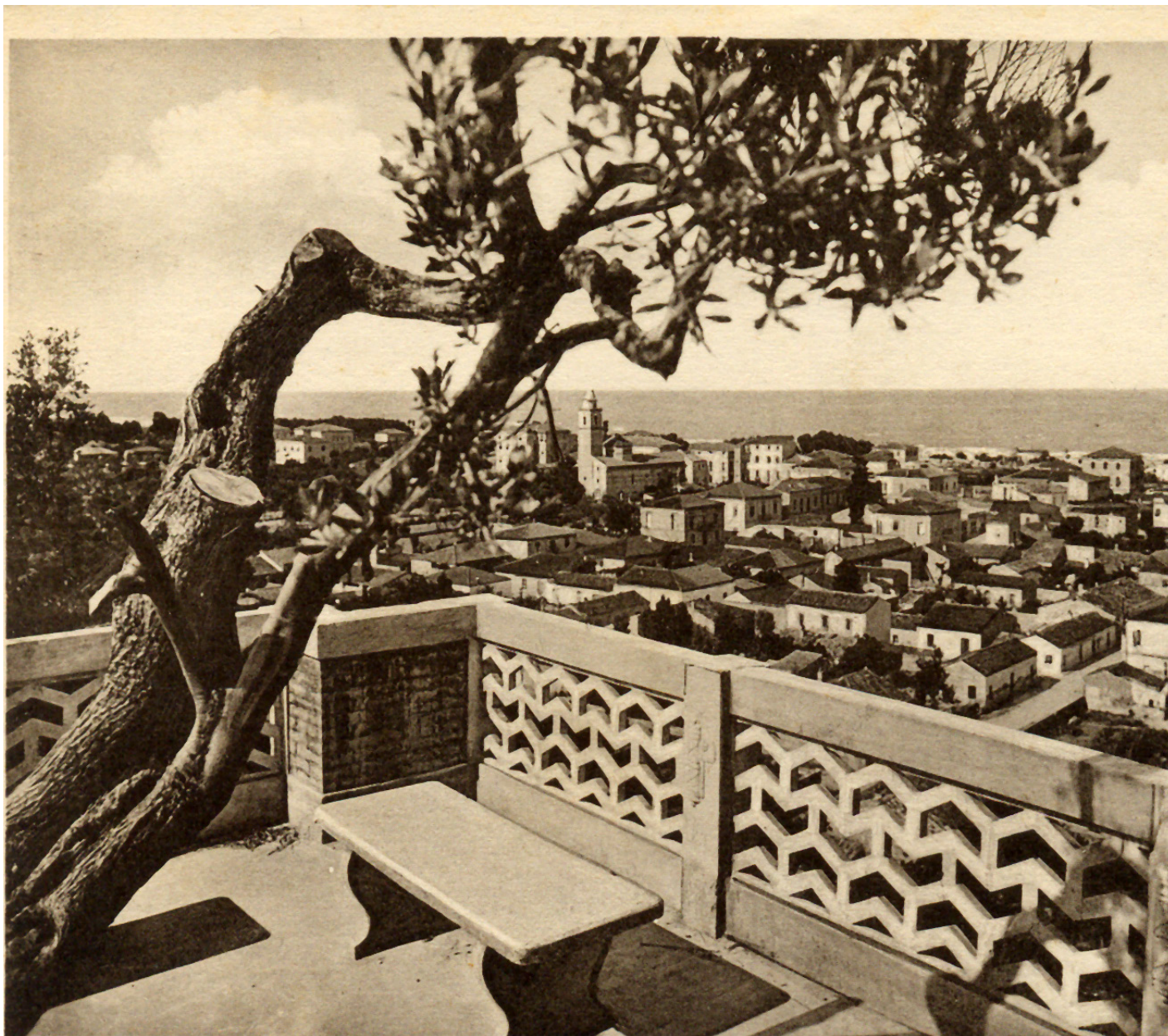
Roseto degli Abruzzi - Panorama dal Belvedere

---- particolare di una cartolina fine anni '50 ----